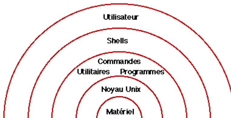
Figure 1 : Architecture Unix

S'ajoute à Unix, sur une station de travail, un environnement graphique (système de fenêtrage) basé sur X-window composé de :